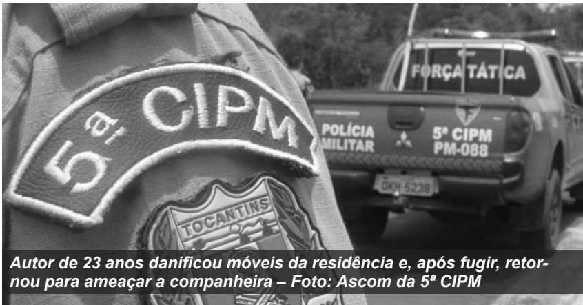
Autor de 23 anos danificou móveis da residência e, após fugir, retornou para ameaçar a companheira

Na madrugada da quarta-feira, 19, a Polícia Militar do Tocantins (PMTO), por meio da 5ª CIPM de Tocantinópolis, realizou a prisão em flagrante de um homem de 23 anos pelos crimes de ameaça e dano no contexto de violência doméstica, em Tocantinópolis. O suspeito havia danificado móveis da residência e, inicialmente, evadido do local. No entanto, a PMTO foi novamente acionada quando o mesmo indivíduo retornou e ameaçou a companheira, também de 23 anos. A guarnição da PMTO realizou diligências e logrou êxito em localizar e prender o autor. O caso foi registrado e o competente Auto de Prisão em