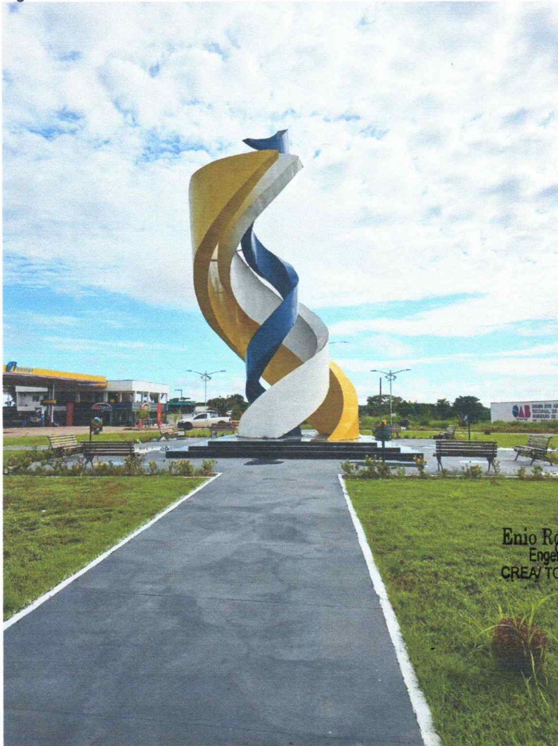
Figura 03 - PORTAL MONUMENTO EM AUGUSTINÓPOLIS – TO

ESTADO DO TOCANTINS PREFEITURA MUNICIPAL DE AUGUSTINÓPOLIS Rua Dom Pedro I, nº 352, Centro – Augustinópolis -TO