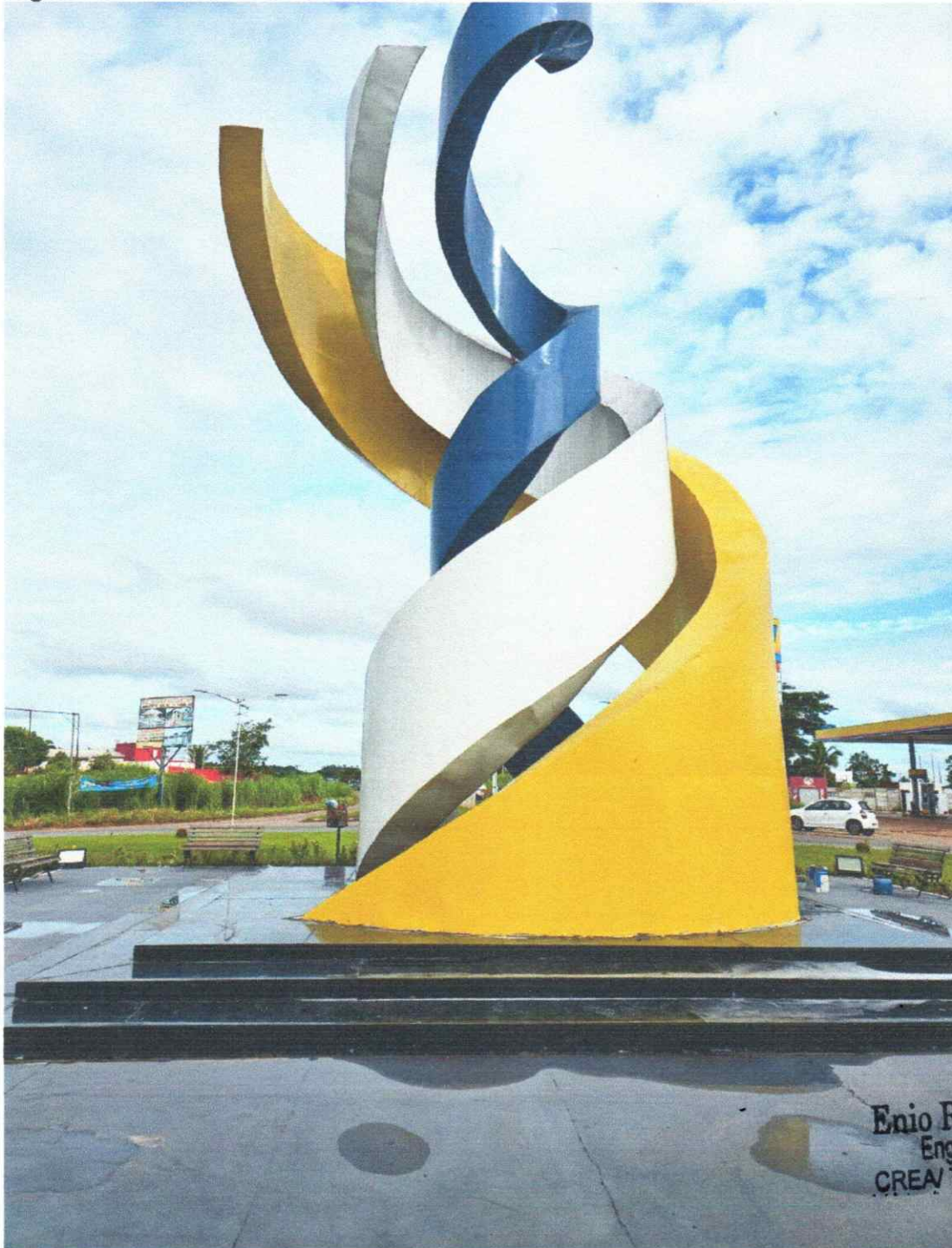
Figura 02 - PORTAL MONUMENTO EM AUGUSTINÓPOLIS – TO

ESTADO DO TOCANTINS PREFEITURA MUNICIPAL DE AUGUSTINÓPOLIS Rua Dom Pedro I, nº 352, Centro – Augustinópolis -TO