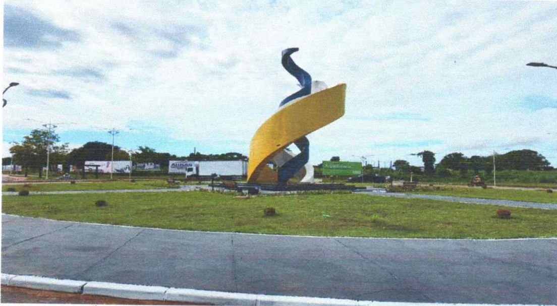
Figura 06 - PORTAL MONUMENTO EM AUGUSTINÓPOLIS – TO

CONSTRUÇÃO DO PORTAL MONUMENTO NA ROTATÓRIA DO TREVO NORTE, COM 100% DA ESTRUTURA EXECUTADO