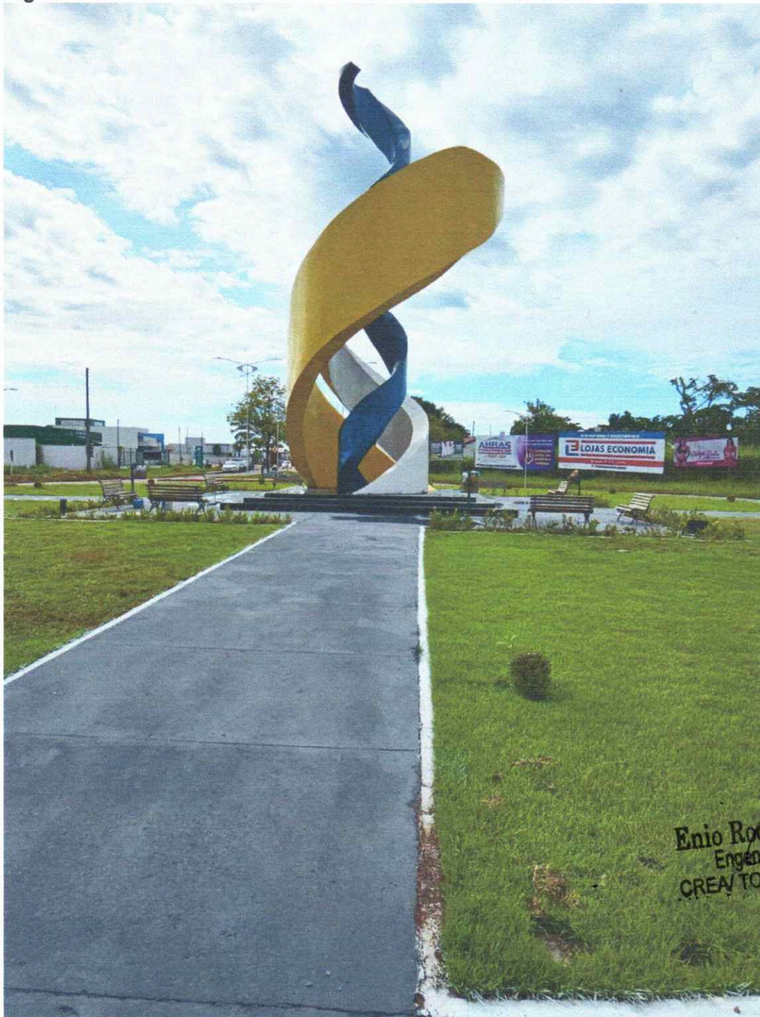
Figura 04 - PORTAL MONUMENTO EM AUGUSTINÓPOLIS – TO

ESTADO DO TOCANTINS PREFEITURA MUNICIPAL DE AUGUSTINÓPOLIS Rua Dom Pedro I, nº 352, Centro – Augustinópolis -TO