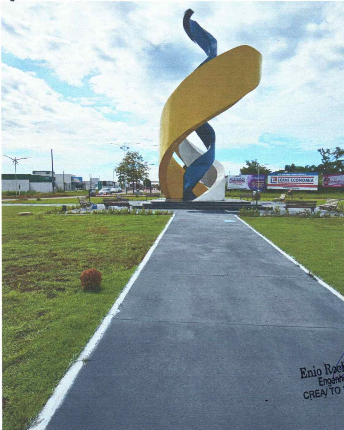
Figura 05 - PORTAL MONUMENTO EM AUGUSTINÓPOLIS – TO

ESTADO DO TOCANTINS PREFEITURA MUNICIPAL DE AUGUSTINÓPOLIS Rua Dom Pedro I, nº 352, Centro – Augustinópolis -TO