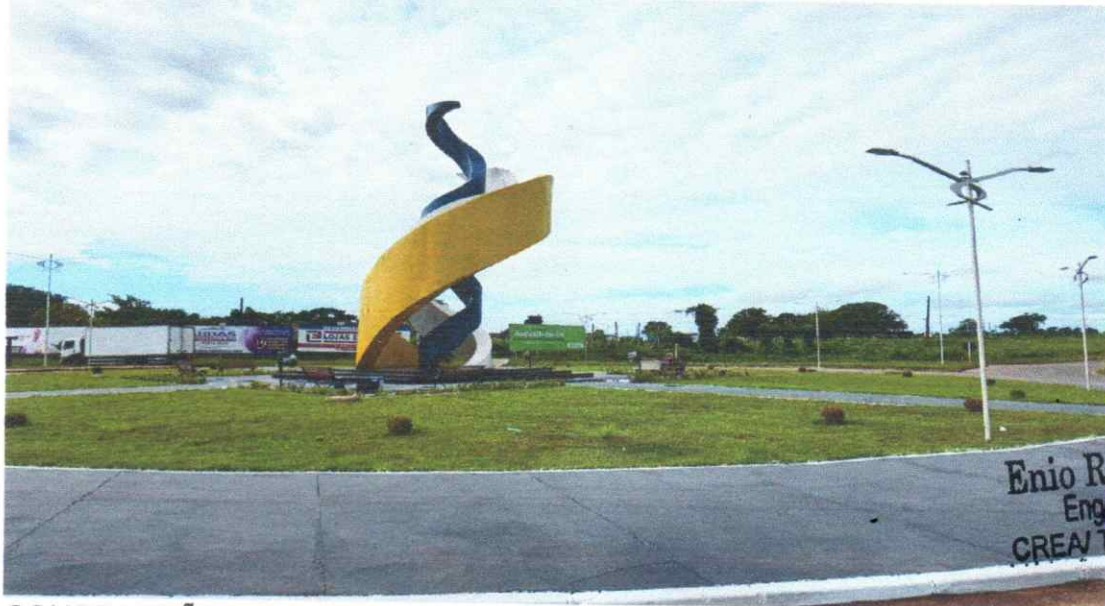
Figura 07 - PORTAL MONUMENTO EM AUGUSTINÓPOLIS – TO

CONSTRUÇÃO DO PORTAL MONUMENTO NA ROTATÓRIA DO TREVO NORTE, COM 100% DA ESTRUTURA E ILUMINAÇÃO EXECUTADO